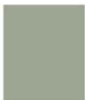
GSOG Vert ancien Oudgroen (~ RAL 130 60 20)