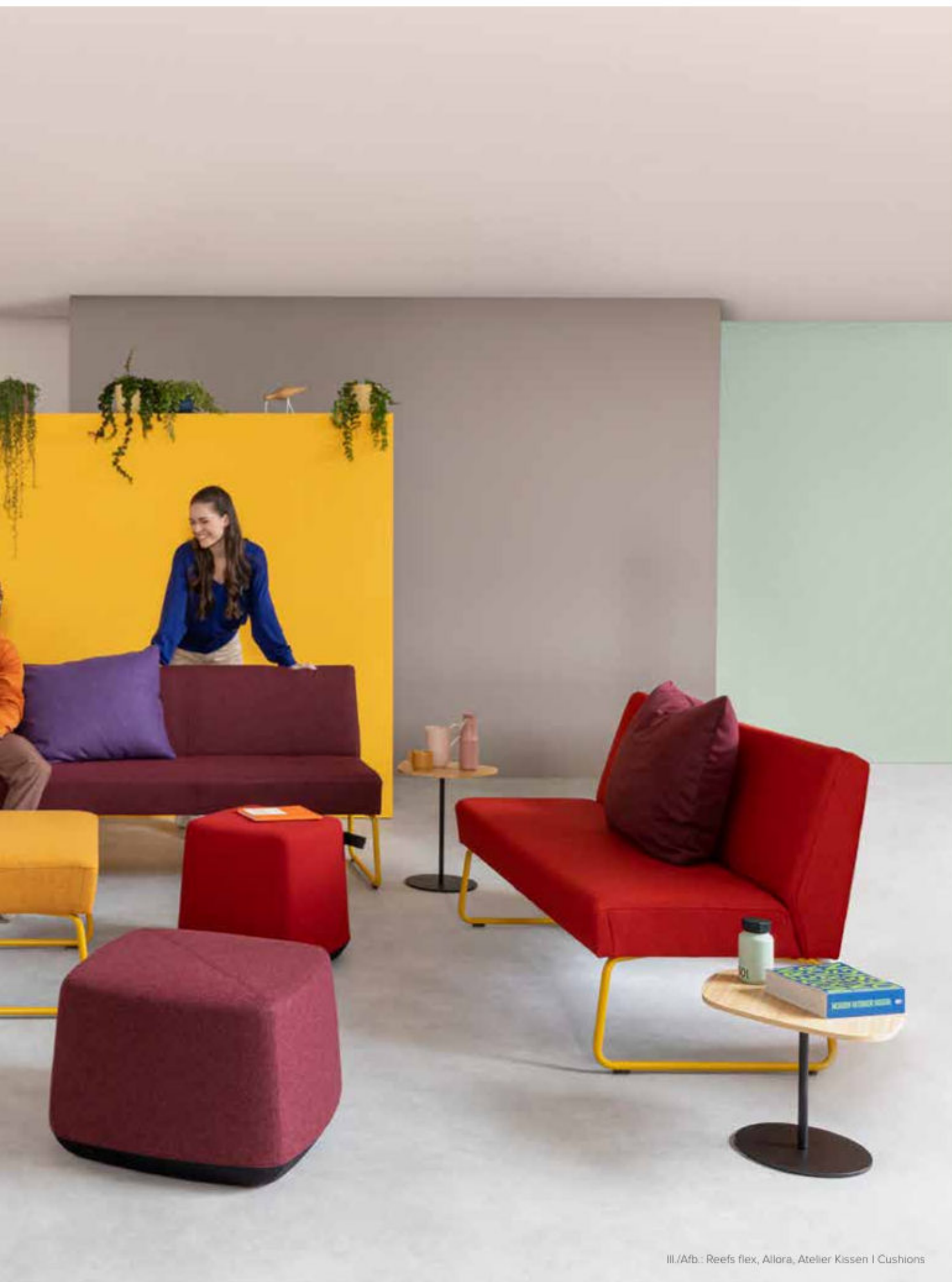
III./Afb.: Reefs flex, Allora, Atelier Kissen | Cushions