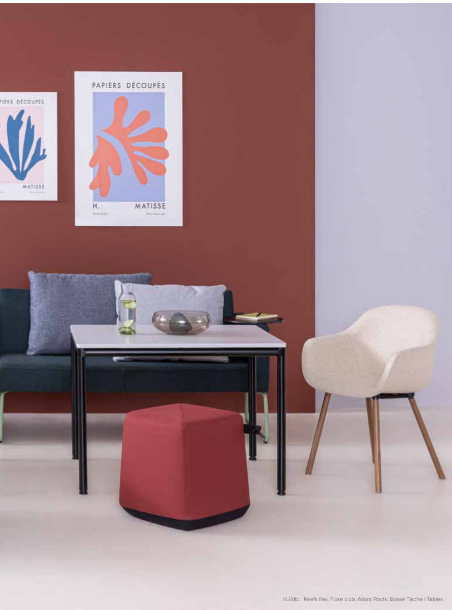
III./Afb.: Reefs flex, Fiore club, Allora Poufs, Bosse Tische | Tables