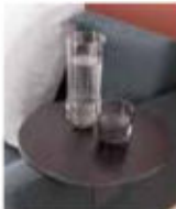
TE 0090 Tablette à clipser Clip-on plank