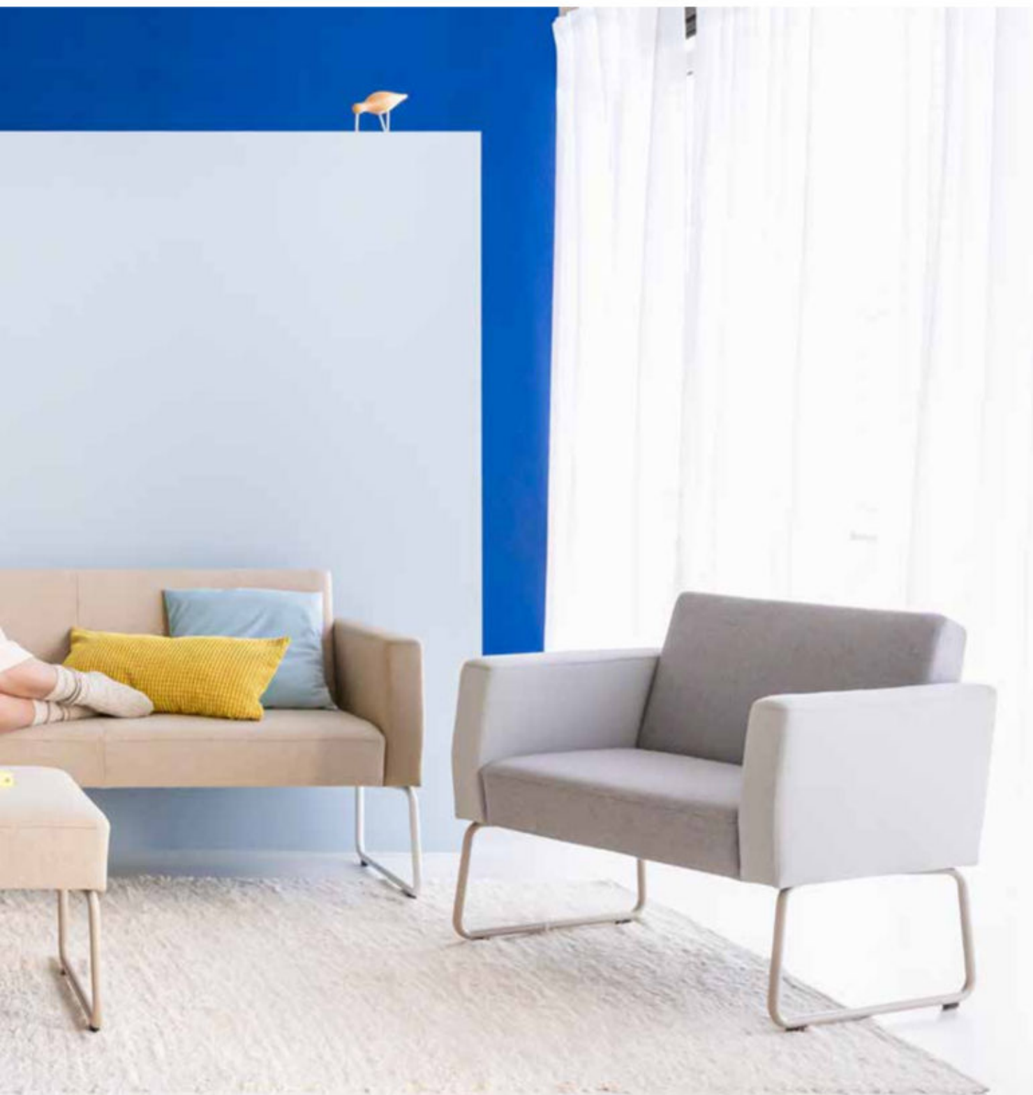
III./Afb.: Reefs flex, Fiore club, Bosse Tisch | Table

Savoir lâcher prise, mettre le travail de côté un moment, et se détendre vraiment... c'est à la maison que ça fonctionne le mieux! Reefs flex a tout ce qu'il faut à cet égard: des éléments de soft-seating merveilleusement conviviaux. Tout un tas de modules et une large palette de couleurs qui s'adaptent parfaitement à vos locaux et votre créativité. Au service de vos postes de travail préférés où l'on se sent bien, où l'on se sent comme chez soi!