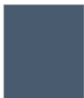
GSBB Bleu de Prusse Berlijns blauw (~ RAL 260 30 15)