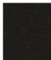
GSGS Noir graphite Grafietzwart (RAL 9011)