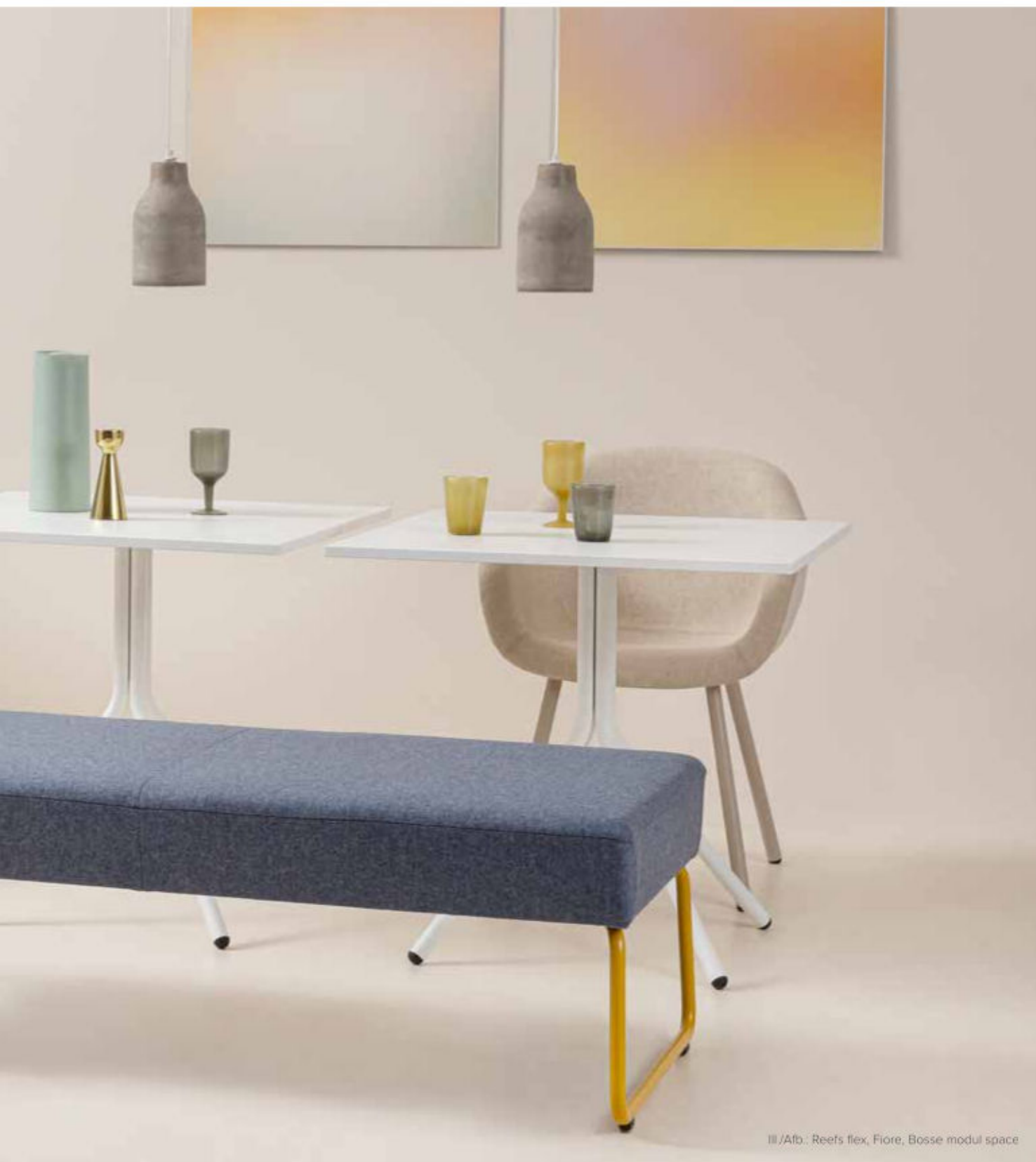
III /Afb.: Reefs flex, Fiore, Bosse modul space

Les paysages de bureau modernes doivent proposer de la diversité. Les postes de travail super équipés et les sièges de bureau ergonomiques sont toujours plébiscités. De même que les véritables alternatives telles que les bancs confortables regroupés et les sièges à accoudoirs. Elles invitent clairement à des échanges spontanées et informels avec les collègues. Pour des rencontres détendues dans un cadre décontracté. Pour des discussions franches et en toute intimité. Tout à fait sous l'inspiration du «new way of working»!