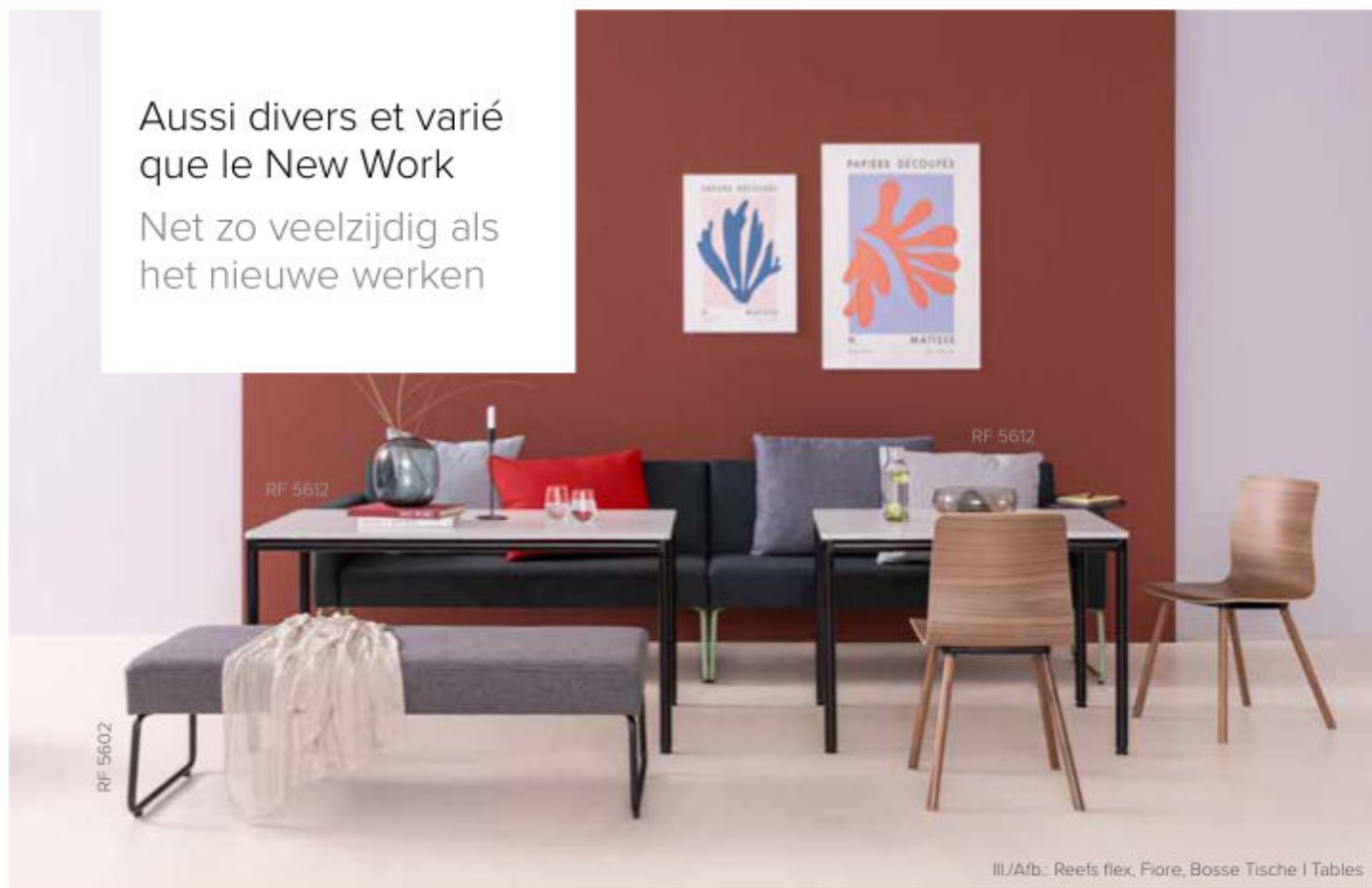
III./Afb.: Reefs flex, Fiore, Bosse Tische | Tables