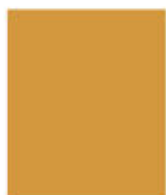
GSSY Jaune moutarde Mosterdgeel (~ RAL 070 60 60)