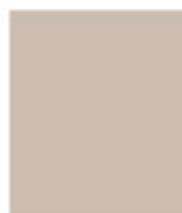
GSKG Ivoire Kitgrijs (~ RAL 060 70 10)