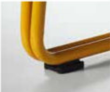
TE 0091 Élément de chaînage Verbindend element