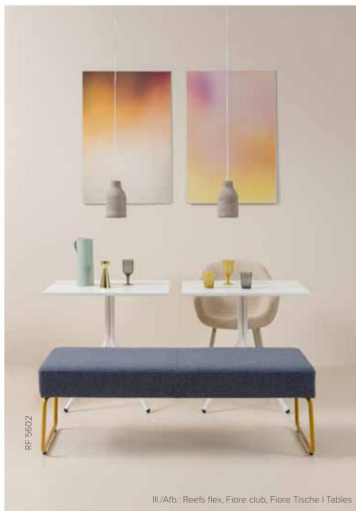
III./Afb.: Reefs flex, Fiore club, Fiore Tische | Tables