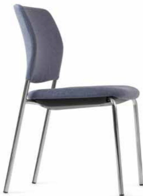
CY 0470 (4fach stapelbar | stackable up to 4-high)