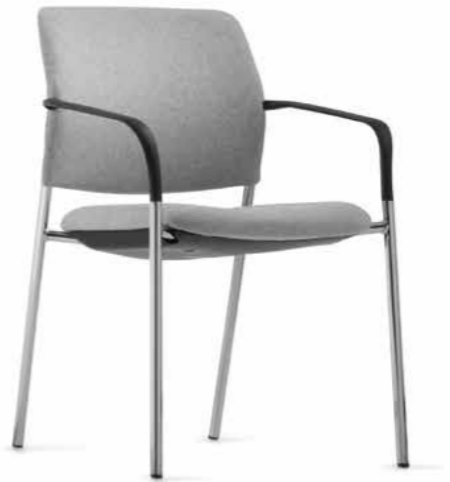
CY 0476 Kunststoff-Armlehnen, nicht nachrüstbar | Plastic armrests, not retrofittable AB05KGS (4fach stapelbar | stackable up to 4-high)