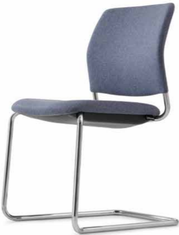
CY 0476 (4fach stapelbar | stackable up to 4-high)

Cay is always comfortable, functional and presents a clear design without being obtrusive. Thanks to their ability to stack them four high, the cantilever chairs and four-legged models can be stored away and save space. The durable, chrome frames are particularly well suited for this purpose.