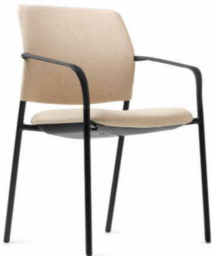
CY 0470 Kunststoff-Armlehnen, nicht nachrüstbar | Plastic armrests, not retrofittable AB05KGS (4fach stapelbar | stackable up to 4-high)