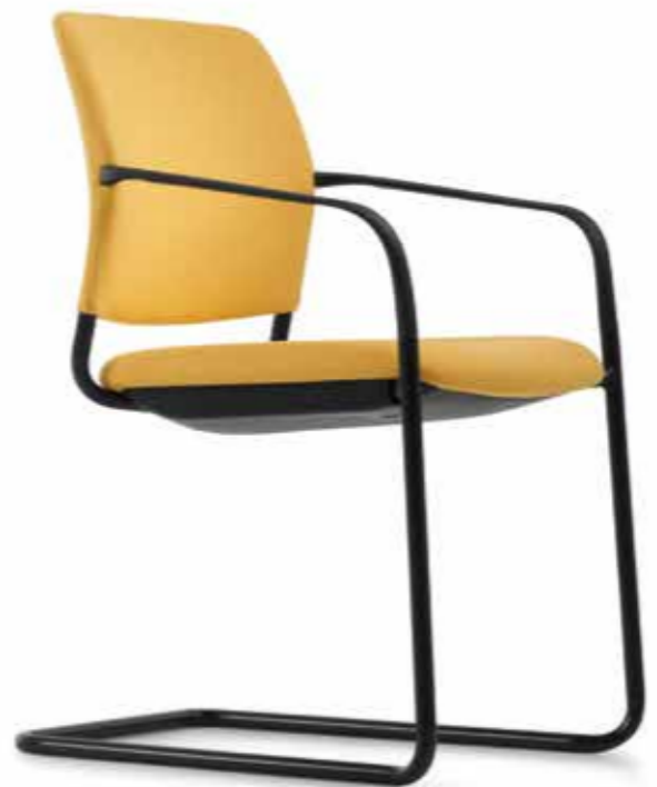
CY 0476 Kunststoff-Armlehnen, nicht nachrüstbar | Plastic armrests, not retrofittable AB05KGS (4fach stapelbar | stackable up to 4-high)