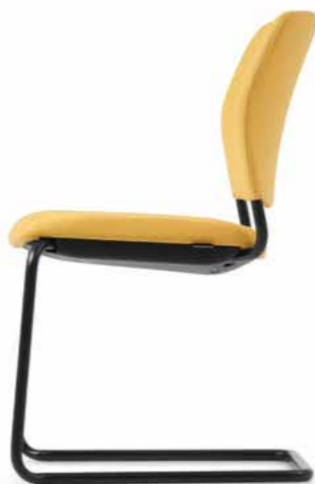
CY 0476 (4fach stapelbar | stackable up to 4-high)