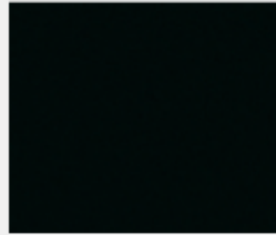
GSGS Schwarz pulverbeschichtet (RAL 9011, Standard) Black powder-coated (RAL 9011, standard)