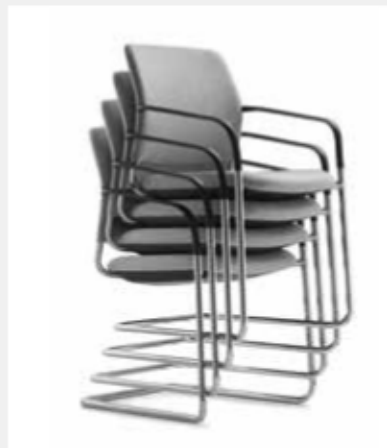
Freischwinger ohne/ mit Armlehnen 4fach stapelbar Cantilever without/ with armrests, stackable up to 4-high