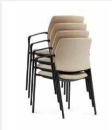
Vierbeiner ohne/ mit Armlehnen 4fach stapelbar Four-legged chair without/with armrests, stackable up to 4-high