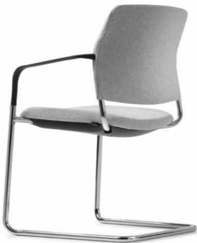
CY 0476 Kunststoff-Armlehnen, nicht nachrüstbar | Plastic armrests, not retrofittable AB05KGS (4fach stapelbar | stackable up to 4-high)