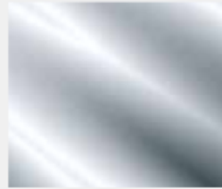
GSCR Verchromt (Option) Chrome (Option)