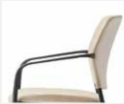
AB05KGS Kunststoff-Armlehnen, nicht nachrüstbar Plastic armrests, not retrofitable