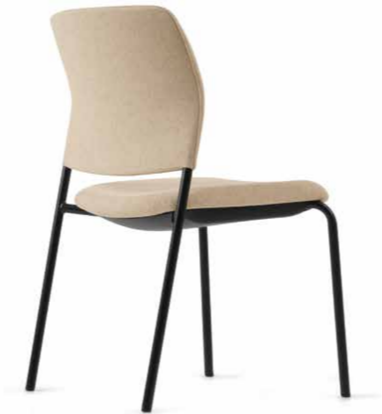
CY 0470 (4fach stapelbar | stackable up to 4-high)

The color black brings structure, order and depth into bright rooms and creates interesting contrasts. The Cay four-legged chairs and cantilevers with their black frames and full upholstery in soft, harmonious fabric tones look modern and individual at the same time.