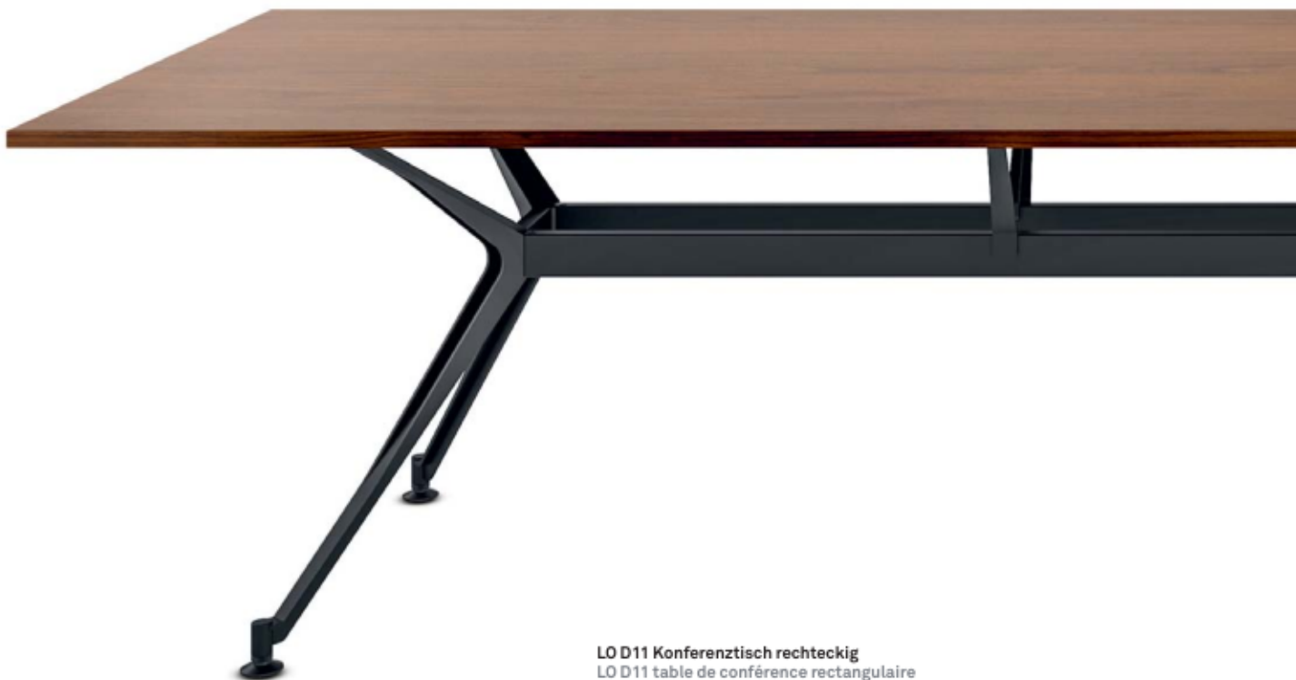
LO D11 Konferenztisch rechteckig LO D11 table de conférence rectangulaire

Forme accueillante, détails utiles: LO D11 est équipée d'un patin permettant de faire glisser la table presque sans effort sur les moquettes, les parquets et le béton. L'électrification sophistiquée fait place nette et permet une partie inférieure du plateau ordonnée grâce à un guidage de câble simplifié.