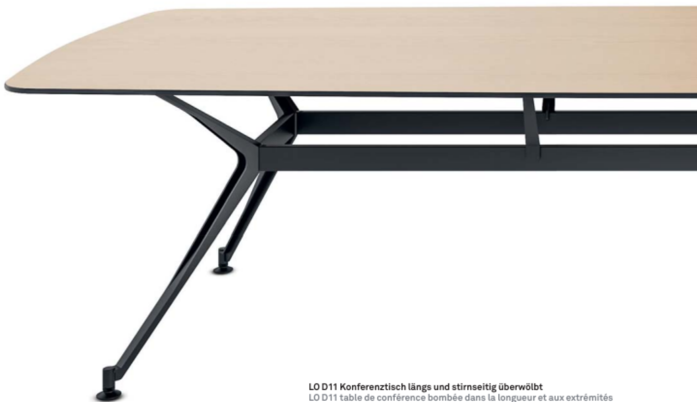
LO D11 Konferenztisch längs und stirnseitig überwölbt LO D11 table de conférence bombée dans la longueur et aux extrémités