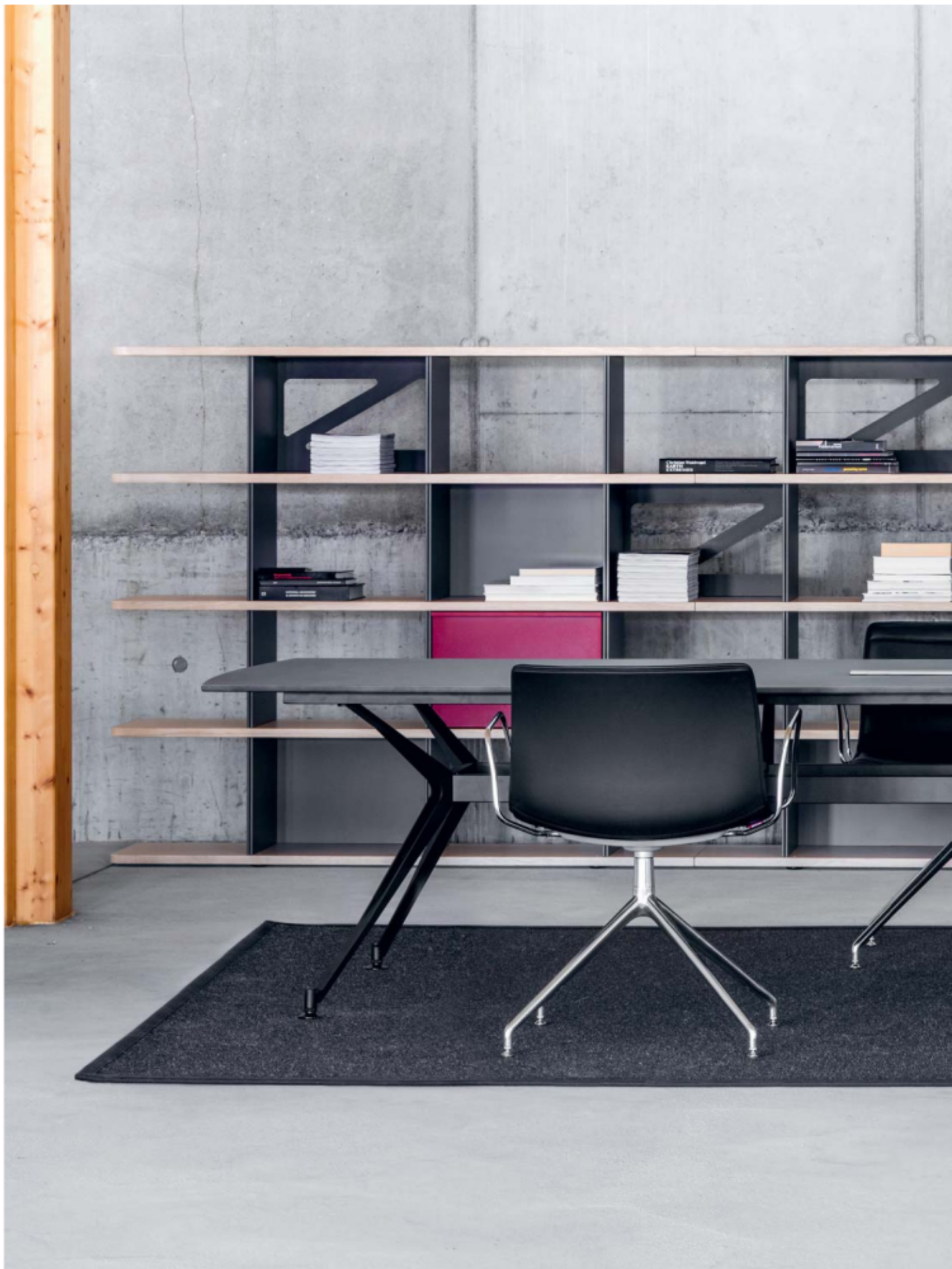
Begegnungsstark im Team: Raumsystem LO Next und Konferenztisch LO D11.

La force d'une rencontre au sein de l'équipe: le système de rangement LO Next et la table de conférence LO D11.