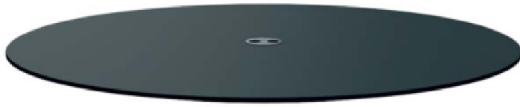
Steckdoseneinheit Bloc multiprises