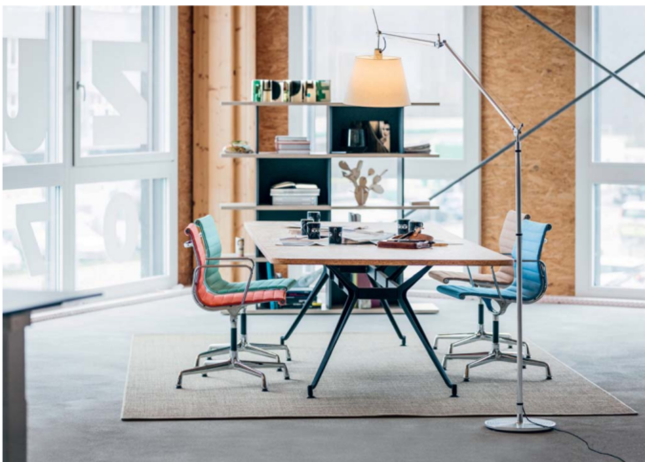
Bei der Besprechung alles zur Hand: LO D11 mit LO Next als griffbereite Ablage. Pendant la réunion, tout est à portée de main: LO D11 avec LO Next, un rangement toujours à disposition.