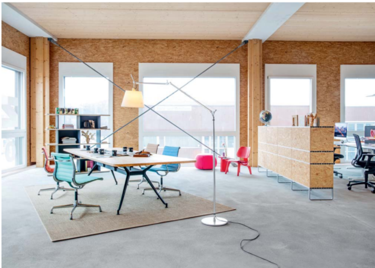
Meetingzone trifft Ablagesystem: LO D11 und LO D3. Rencontre d'un espace de réunion et d'un système d'archivage: LO D11 et LO D3.