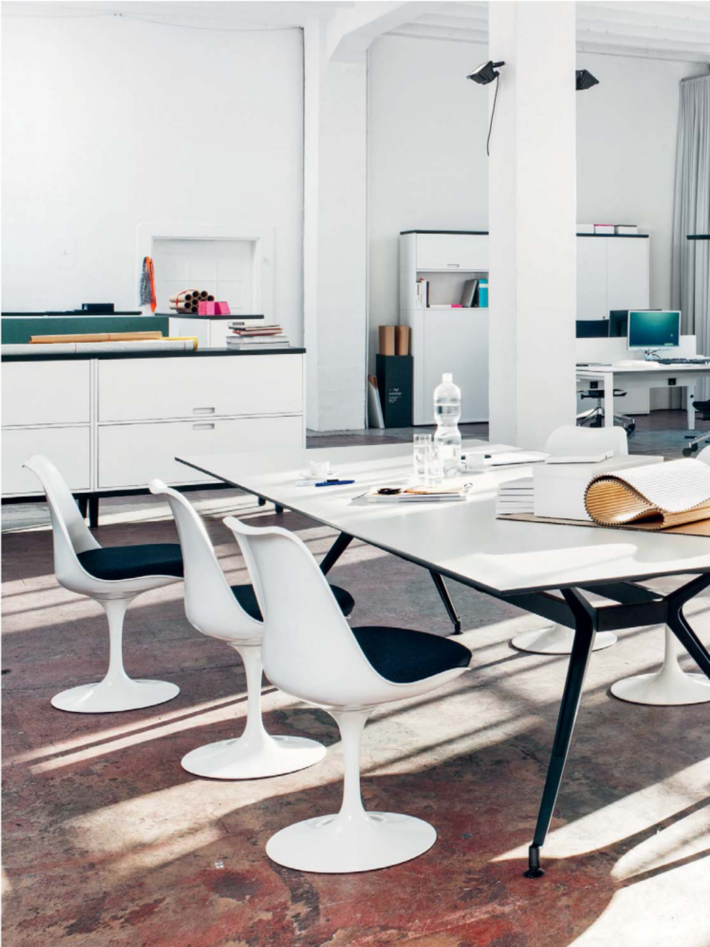
Die Kompetenz des Gesamtanbieters an einem Tisch: LO D11 und Saarinen Tulip Side Chairs von Knoll. La compétence d'un fournisseur global autour d'une table: LO D11 et les chaises Saarinen Tulip de Knoll.