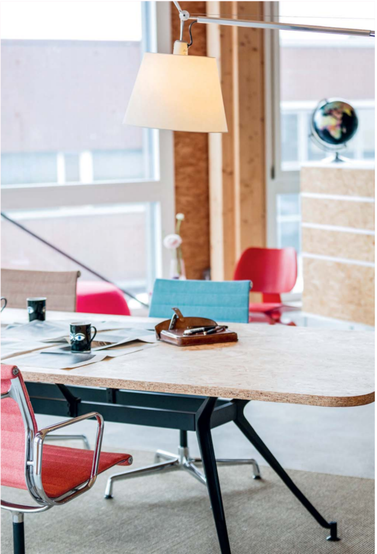
Das Meeting der Materie: LO D11 mit Tischfuß aus Stahl und Tischplatte aus Rohspan. La rencontre des matériaux: LO D11 avec pieds en acier et plateau en panneau de particules brut.